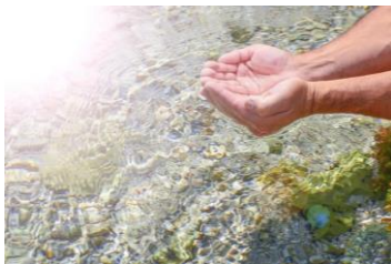
Giám sát chất lượng nước sạch

Trong năm 2025, Tổng Công ty đã lên kế hoạch giám sát chất lượng nước theo quy định hiện hành của Nhà nước.