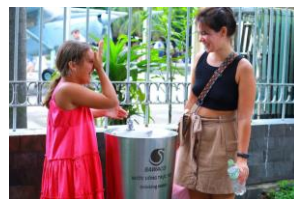
Nước uống trực tiếp tại vòi

Dự kiến trong năm 2025, Tổng Công ty sẽ phối hợp với chính quyền địa phương để lắp đặt thêm khoảng 100 trụ nước uống công cộng trên địa bàn thành phố.