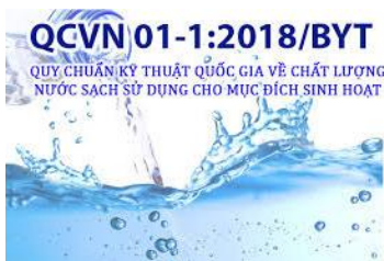
Tiêu chuẩn áp dụng

SAWACO đang áp dụng quy chuẩn kỹ thuật quốc gia về chất lượng nước sạch sử dụng cho mục đích sinh hoạt (QCVN 01-1:2018/BYT) được Bộ Y tế ban hành năm 2018.